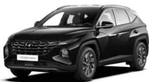
Abyss Black Pearl (A2B)