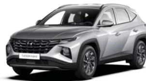
Shimmering Silver Metallic (R2T)