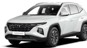
Atlas White (SAW)