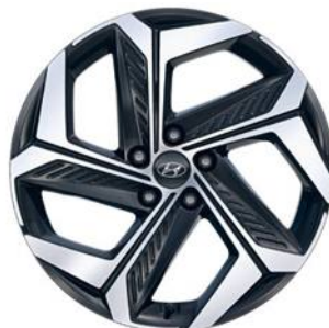
Ζάντες αλουμινίου 19"