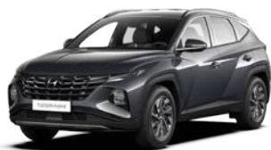
Dark Knight Gray Pearl (YG7)