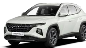
Serenity White Pearl (W6H)