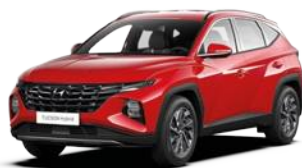
Engine Red (JHR)