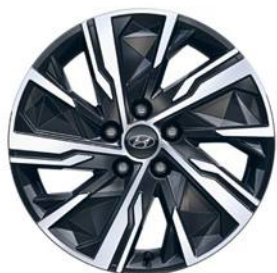
Ζάντες αλουμινίου 17"