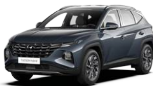
Dark Teal Metallic (TG8)