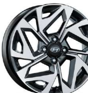
Ζάντες Αλουμινίου N Line 16"