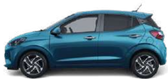
Aqua Turquoise Metallic (U3H) ●