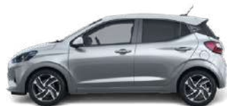
Sleek Silver Metallic (RYS) ●