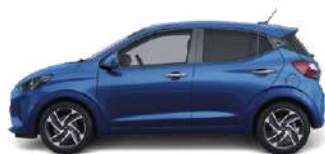
Intense Blue Pearl (YP5) ●