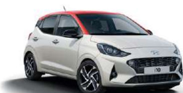
Polar White (PSW) με κόκκινη οροφή (TTR)