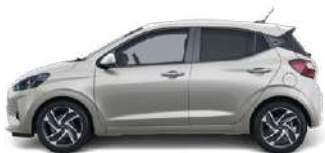
Polar White (PSW)* ●●