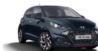
Phantom Black Pearl (X5B) ●