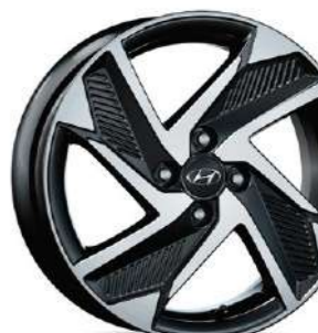
Ζάντες Αλουμινίου 16"