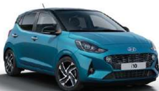
Aqua Turquoise Metallic (U3H) με μαύρη οροφή (X5B)