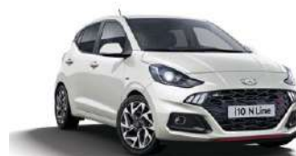
Polar White (PSW)* ●●