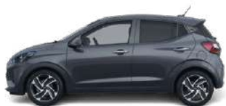
Aurora Grey Pearl (A7G) ●