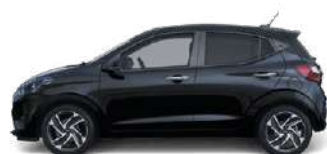
Phantom Black Pearl (X5B) ●