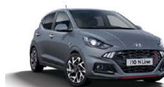
Aurora Grey Pearl (A7G) ●