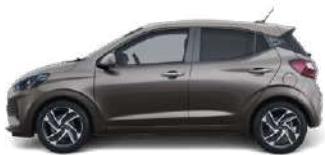
Elemental Brass Metallic (R3W) ●●