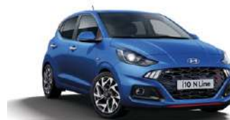
Intense Blue Pearl (YP5) ●