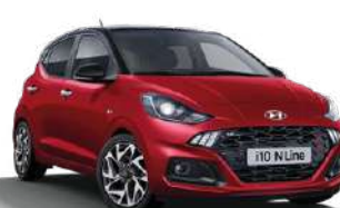
N Line Dragon Red Pearl (WR7) με μαύρη οροφή (X5B)