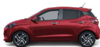
Dragon Red Pearl (WR7) ●