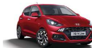
Dragon Red Pearl (WR7) ●