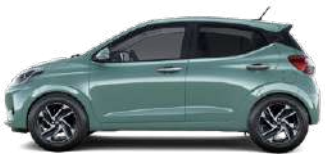
Mangrove Green Pearl (MG2)