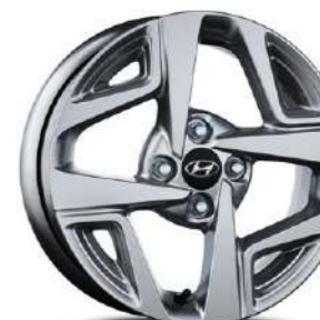
Ζάντες Αλουμινίου 15"