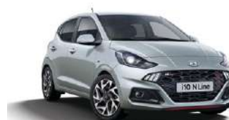
Sleek Silver Metallic (RYS)