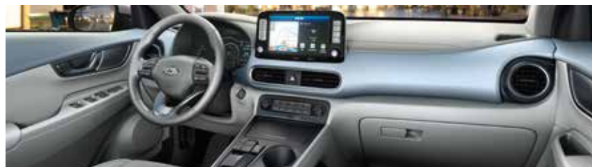
Τρίτο Γκρι-Μπλε εσωτερικό SRX (προαιρετικό, μόνο με επένδυση καθισμάτων δερμάτινη ή συνδυασμό δέρματος-υφάσματος, και μόνο σε συνδυασμό με τα εξωτερικά χρώματα Chalk White και Galactic Grey)