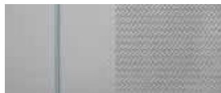
Δερμάτινο γκρι κάθισμα SRX