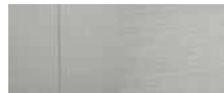
Δερμάτινο-υφασμάτινο γκρι κάθισμα SRX