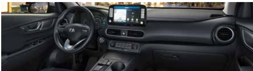
Μαύρο εσωτερικό TRY (standard)