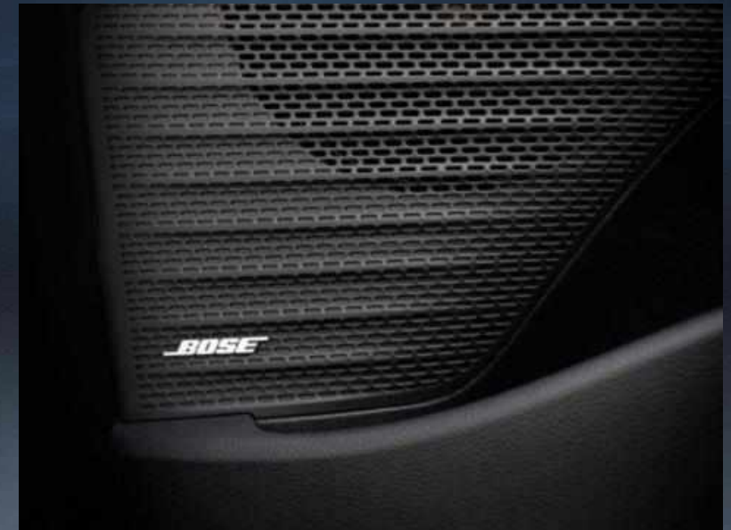
Premium ηχοσύστημα BOSE®