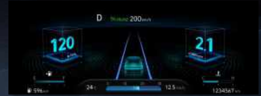
Ψηφιακός πίνακας οργάνων με επιλογή μοτίβου