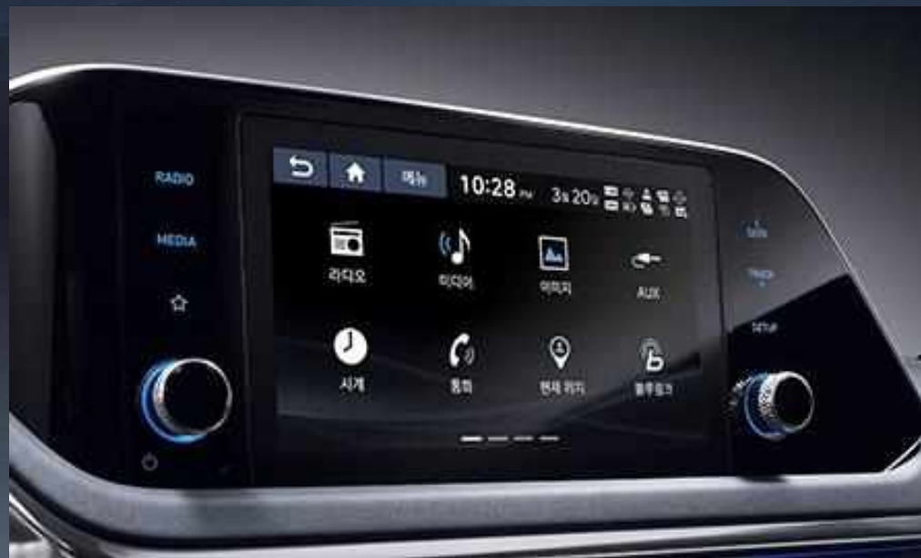
Οθόνη αφής 8" με κάμερα οπισθοπορίας και δυναμικές γραμμές καθοδήγησης

Η πλοήγηση και οι αγαπημένες εφαρμογές του κινητού σας προβάλλονται στην οθόνη πολυμέσων, με πρωτοποριακή ασύρματη σύνδεση από τις εφαρμογές Apple CarPlay™ και Android Auto™. Και με θύρα USB ταχυφόρτισης, είστε πάντα γεμάτοι με ενέργεια.