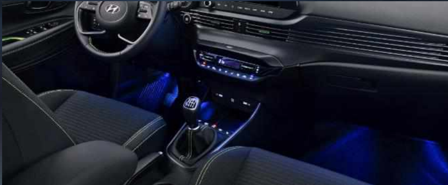
Εσωτερικός ατμοσφαιρικός φωτισμός